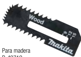
Para madera B-49719